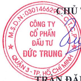
TRẦN ĐĂNG QUÂN